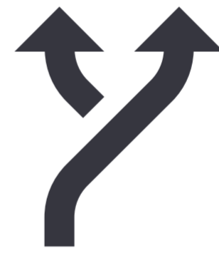
Vários caminhos seguindo um mesmo fluxo