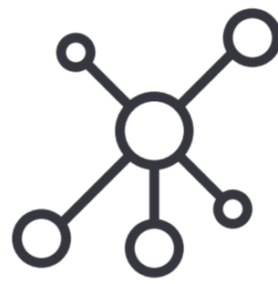
Conexão entre pessoas; O ser humano no centro das evoluções